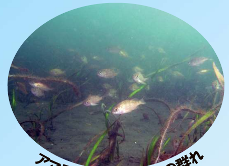
アマモ場を泳ぐメバルの群れ