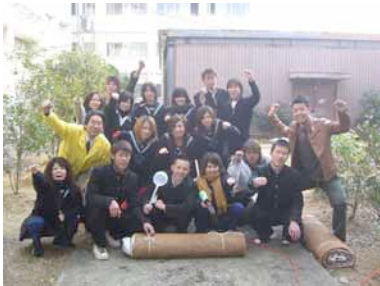
せんなん里海公園