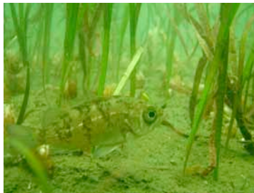
アマモ場とメバル