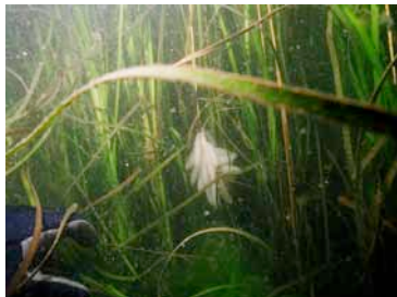
アマモ場とアオリイカの卵

アマモシート敷設後、2年～3年後に群落を形成され、アオリイカやコウイカの産卵場、ヨウジウオ、ヒメイカ等の生育場、メバル、ウミタナゴ、タイ、タコ等の餌場であるばかりでなく、二枚貝等の生息環境の改善にも寄与することが期待できます。