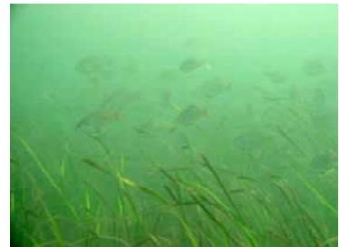
アマモ場とメバルの群