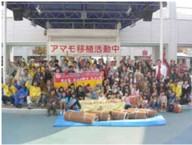
ベイサイドマリーナ浅場