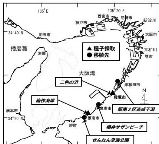
図1 種子採取場所及び移植先

H16年度からアマモ場の再生に取り組んできました。まだ最適な方法を見出したとは言えませんが、現在の取り組みの概要について紹介します。