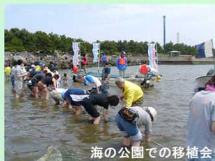
海の公園での移植会

アマモとアマモ場、そこに集まる生き物について学ぶことができるので、移植会と合わせての参加をおすすめします。