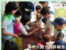
海の公園での移植会