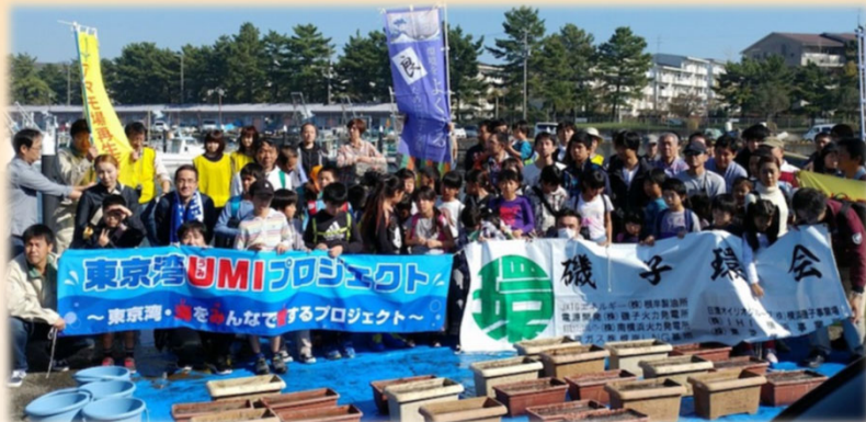
過年度の苗床づくりとタネまき会のようす