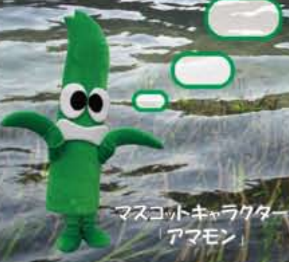
マスコットキャラクター アマモン

おかしの東京湾にはたくさんアマモが はえていたんだ。でも海の水が汚れたり 海辺が埋め立てられたりしたことで 東京湾のアマモはほとんどなくなって しまったんだ。