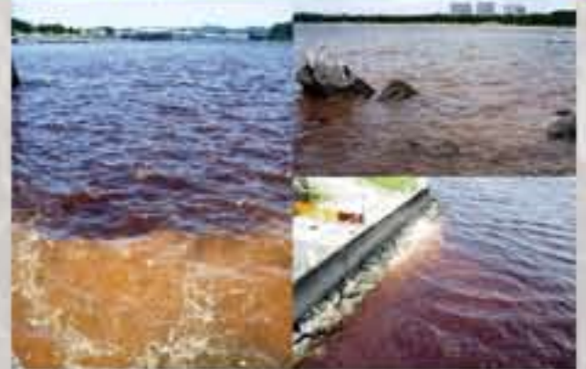
行の公日に発生した赤潮

埋立によってアマモがはえる 浅い海がなくなったことと、 東京湾に汚れた川の水が たくさん流れ込んでいるせいで 毎年赤潮が発生しています。